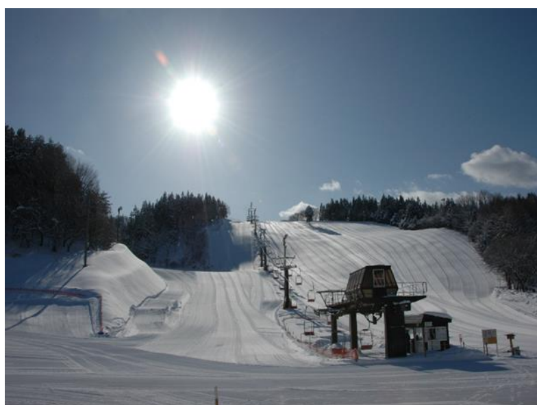
(そうまロマントピアスキー場 ゲレンデ)